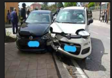
Auto finiscono sul marciapiede