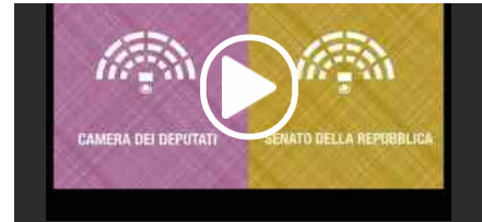
VIDEO – Elezioni 4 marzo: Camera e Senato, ecco come saranno assegnati i seggi