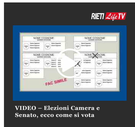
VIDEO – Elezioni Camera e Senato, ecco come si vota