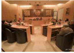
Sintesi di Maggioranza al Consiglio Comunale del 2...