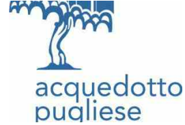
Migliora la pressione nelle reti su tutto il terri...