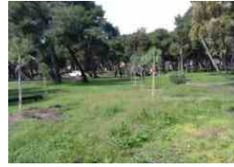
65 nuovi alberi nella pineta di Siponto