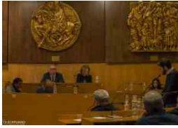
Sintesi di Opposizione al Consiglio Comunale del 2...