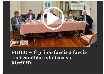
VIDEO – Il primo faccia a faccia tra i candidati sindaco su RietiLife

Nei racconti dovranno emergere tre parole-concetti chiave; periferie , povertà educativa, comunità educante. Gli autori dei racconti selezionati, inoltre, parteciperanno all'evento conclusivo del contest letterario a Roma , alla presenza di rappresentanti delle istituzioni, delle Fondazioni, del terzo settore, delle scuole e dei ragazzi.