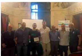
Terminillo Marathon-Biemme, il 4 giugno il meglio dei ciclomaster in città