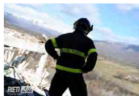
Terremoto, la Cisl: "No a chiusura campo base dei pompieri di Cittareale"