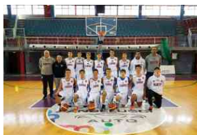
L'Under 16 RietiLife alla sesta vittoria di fila, ora attende la sfidante in Coppa Lazio