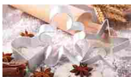
Stampi e Formine di Natale per biscotti e pasta. Consegna in 2 giorni.