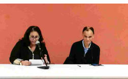
Ventimiglia: Magdi Cristiano Allam sui migranti "La tesi delle guerre o del...