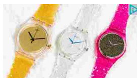
Il regalo perfetto è a portata di click! Prova ora l'Holiday Gift Finder. Scegli il regalo perfetto