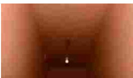
Mente perversa (Foto). SBAGLIATO! Non è quello che pensi di vedere