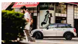
L'auto che ti costa solo quando la guidi! Da 0,31€/min, 480 BMW e MINI a Milano. DriveNow Carsharing