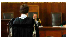
Presunte irregolarità elettorali: ancora problemi per Ferdin...