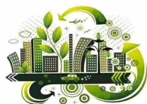
Monitorare situazioni di pericolo, parcheggi per disabili o ridurre i rifiu...