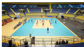
Lo sport che fa bene fuori dal campo: Fiat Torino e Marco Be...