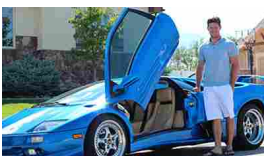
Un milionario 27enne parla del suo lavoro da 500€ all'ora. Scopri di più...