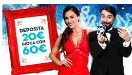
A Natale deposita 20 € e gioca con 60 €! Apri un conto ora! Starcasinò. Ora lo so!